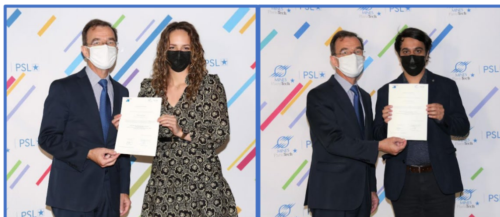
Remise de l'attestation de diplôme à la promotion 2019