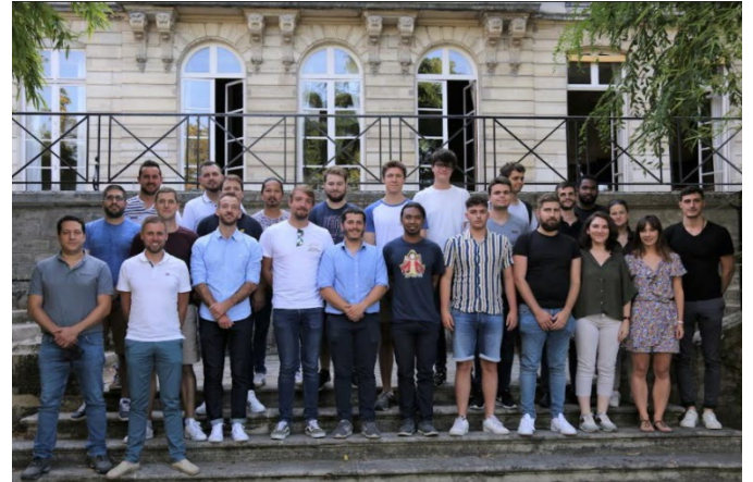
Promotion 2021 – Formation en apprentissage et formation continue

BALAS, ARTELIA, EQUANS, EDF, ENEDIS, EDF EDVANCE, MBDA France, DALKIA, EPI, SNEF CLIM, RTE, BOUYGUES ES, TRACTEBEL, GRDF, CSTB, SENERGY'T, RCFE INGENIERIE